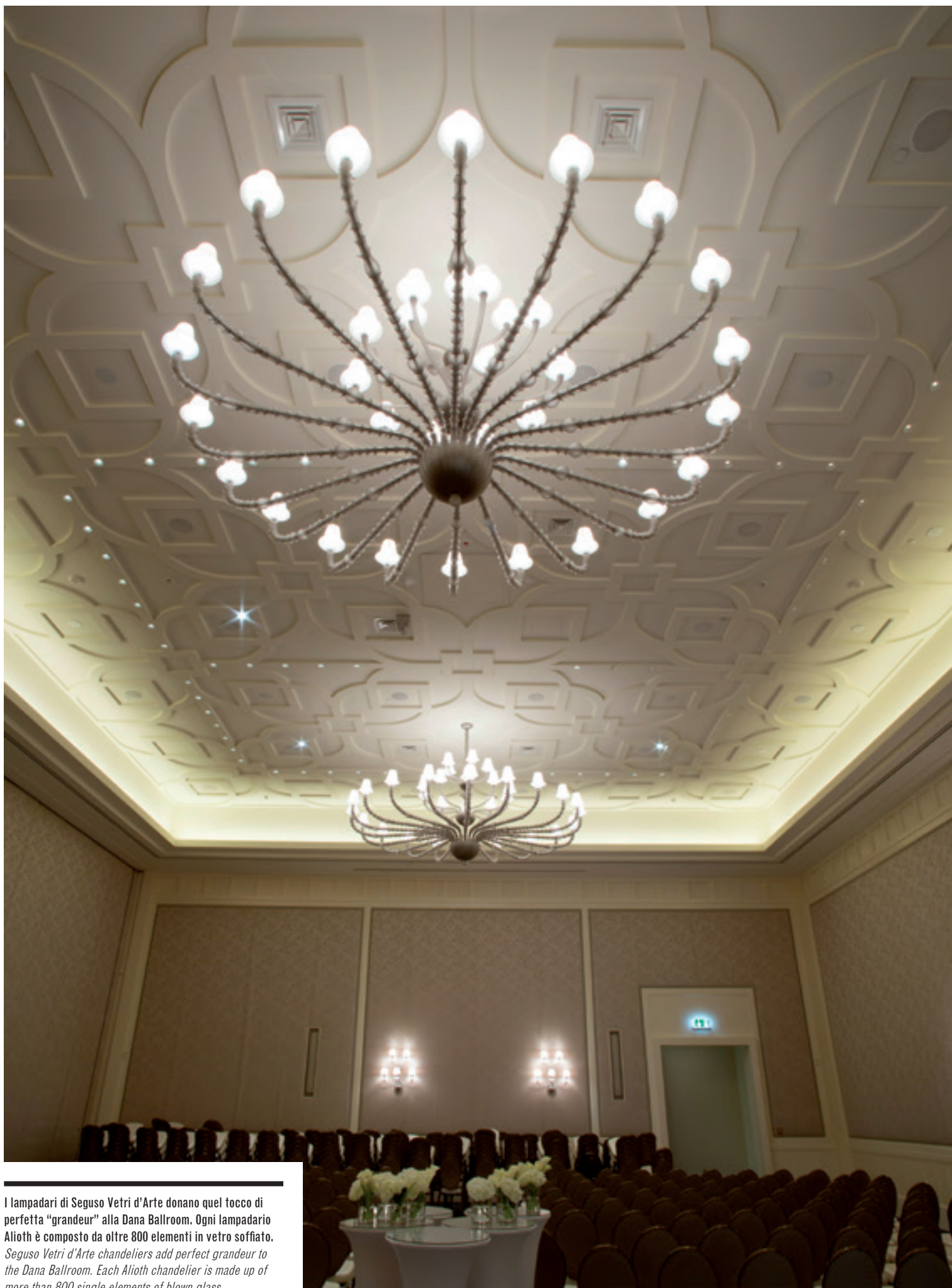
I lampadari di Seguso Vetri d'Arte donano quel tocco di perfetta "grandeur" alla Dana Ballroom. Ogni lampadario Alioth è composto da oltre 800 elementi in vetro soffiato. Seguso Vetri d'Arte chandeliers add perfect grandeur to the Dana Ballroom. Each Alioth chandelier is made up of more than 800 single elements of blown glass.