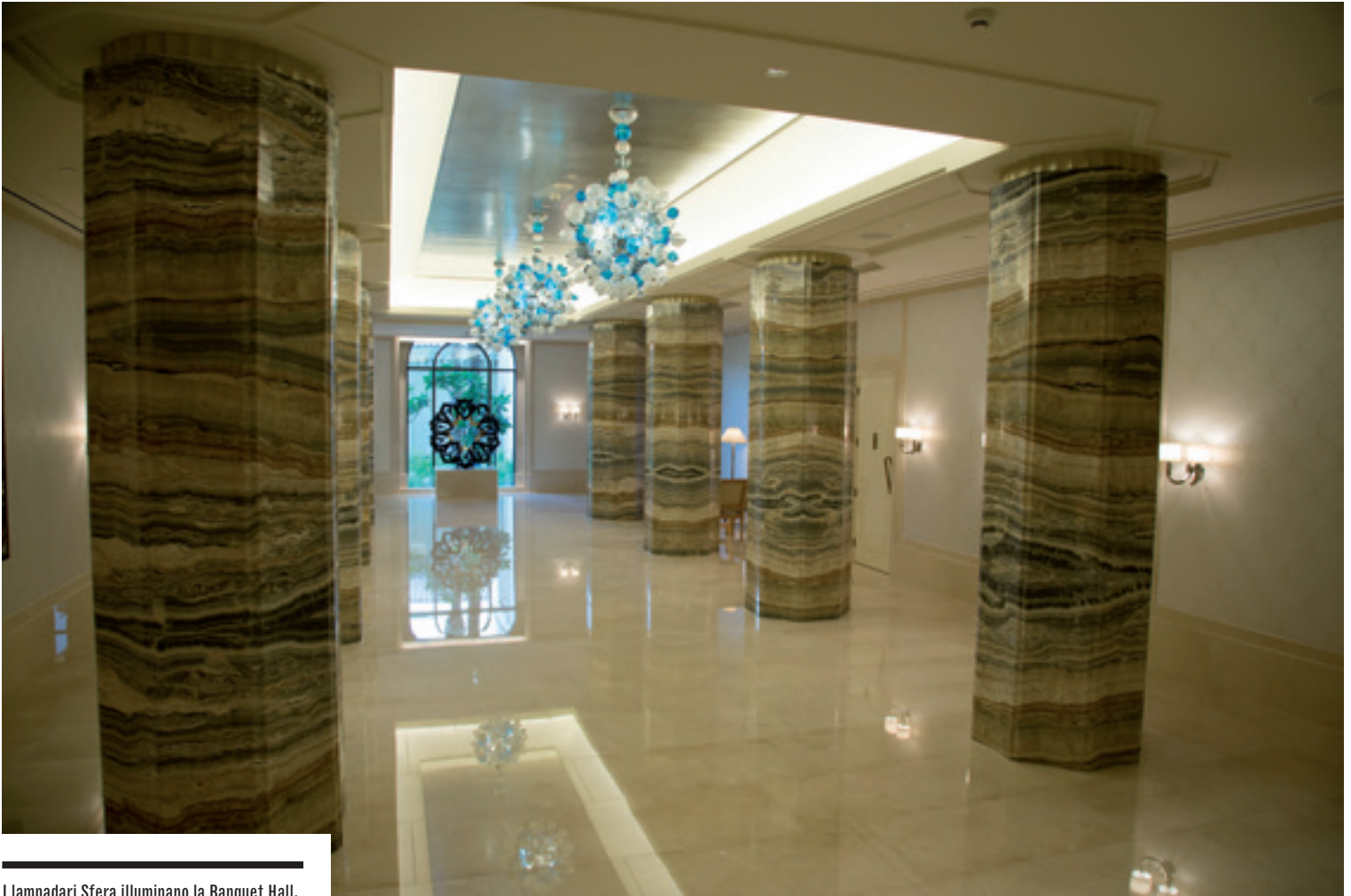
I lampadari Sfera illuminano la Banquet Hall. Questo modello mostra le numerose tecniche di lavorazione del vetro di Murano. The Sfera chandeliers lightening up the Banquet Hall. This model showcases numerous Muranese glassmaking techniques.