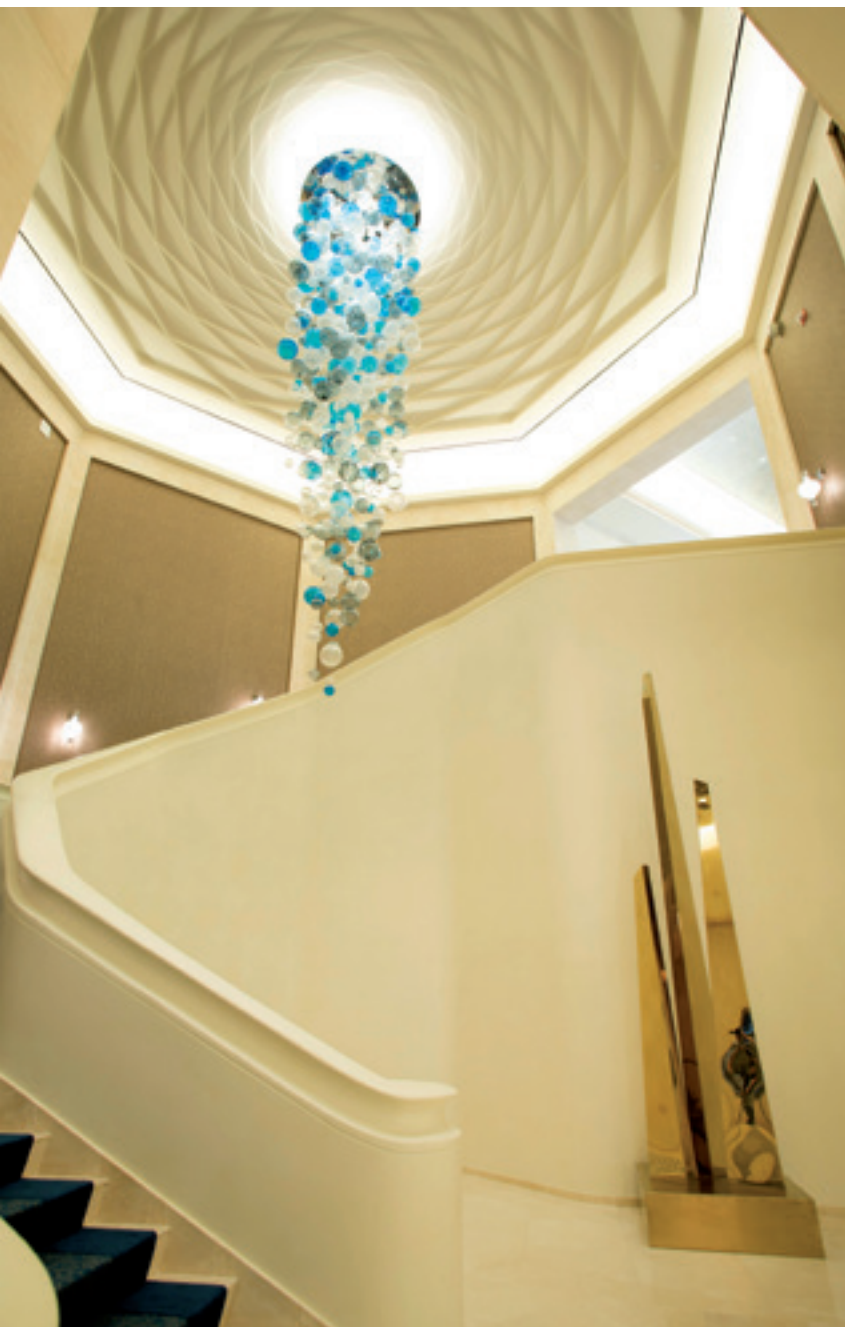
Lampadario Sfera di oltre 6 metri per illuminare le scale. The Sfera chandelier of over 6 mt lights the staircase.

of light featuring hundreds of grey and light blue transparent crystal spheres, interacting in an intricate game of reflections and combining superior craftsmanship and design, in a unique aesthetic effect.